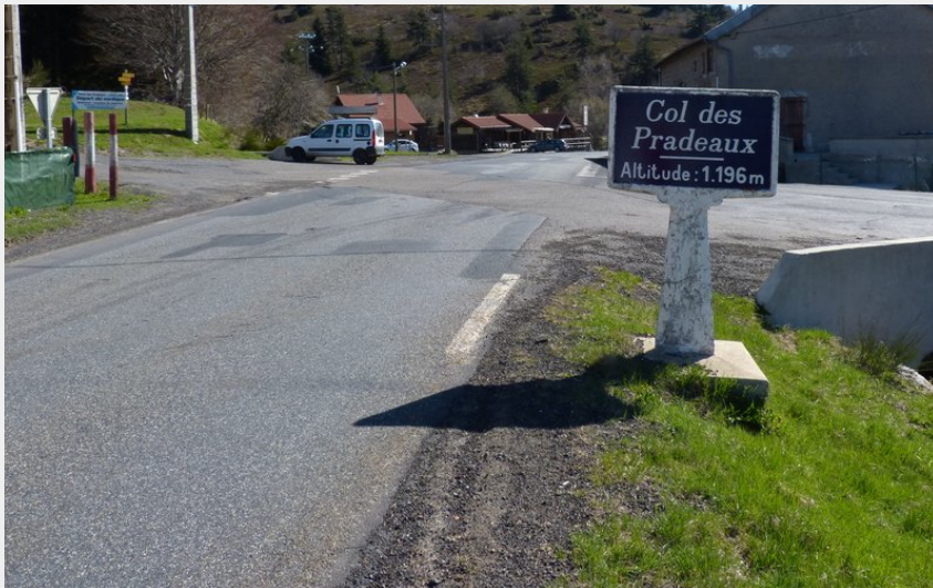
Col des Pradeaux (Maison du Tourisme)