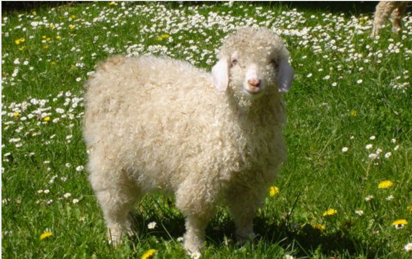
Chèvre angora dans l'herbe (Mohair des fermes de France)