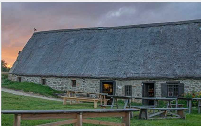
Jasserie du Coq noir