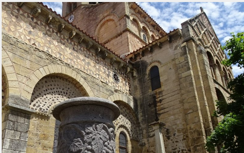
L'Église Saint-Julien (CC Billom Communauté)