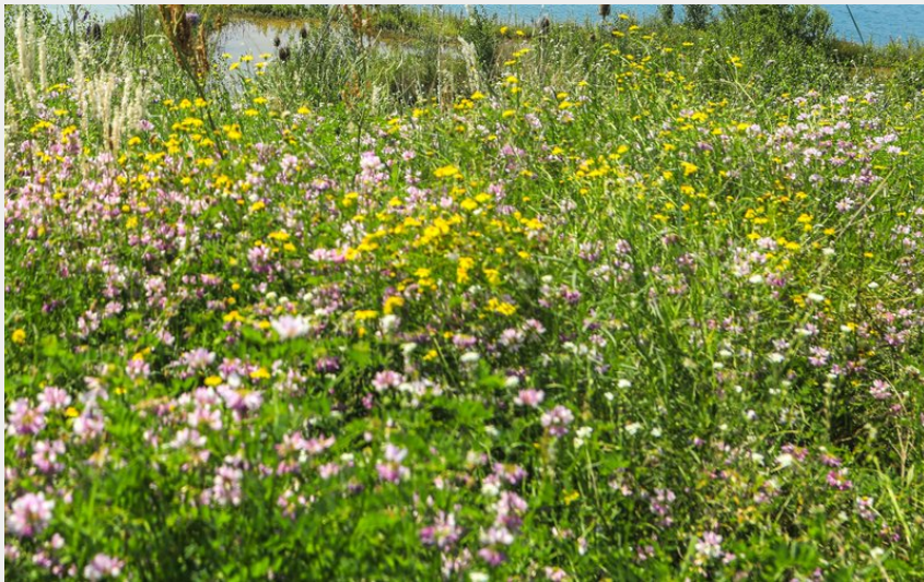
Vue sur l'éco pôle du Val d'Allier (David Frobert)