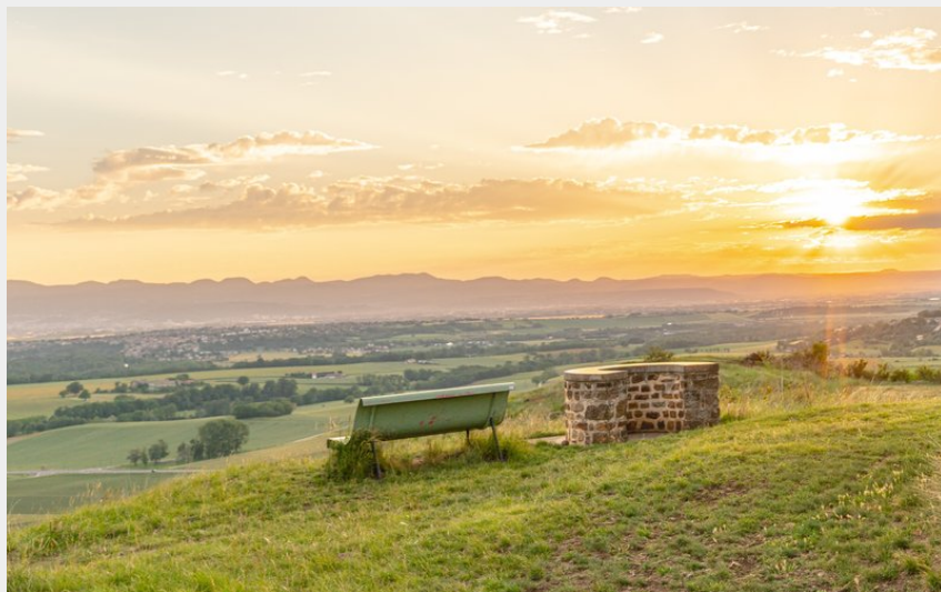
Vue sur la chaîne des Puys (Denis Grudet)