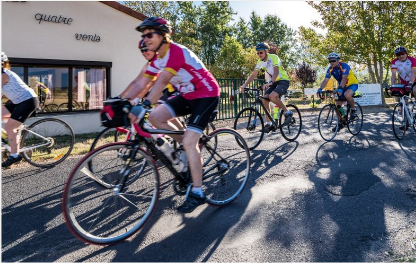
(Centre les 4 Vents)