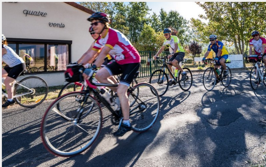
(Centre les 4 Vents)