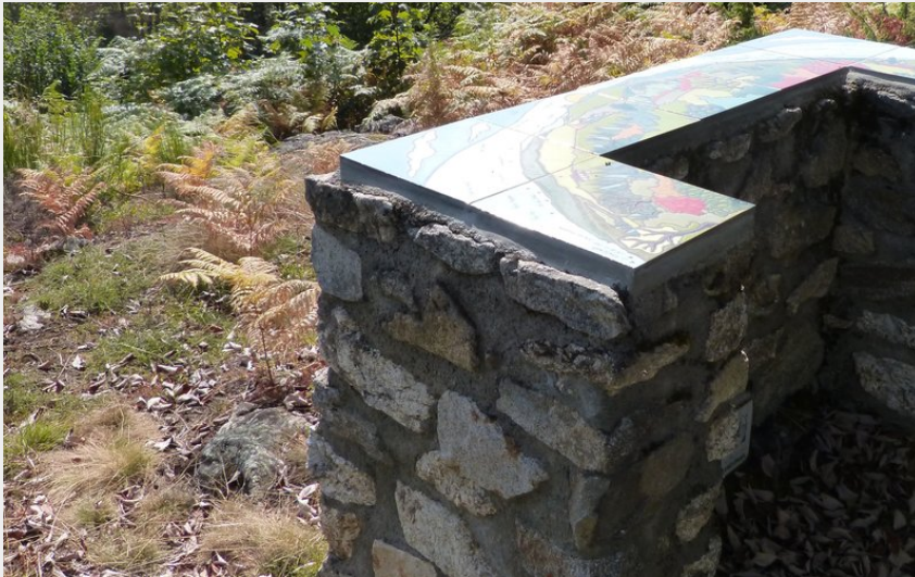
Point de vue depuis la table d'orientation (MDT)