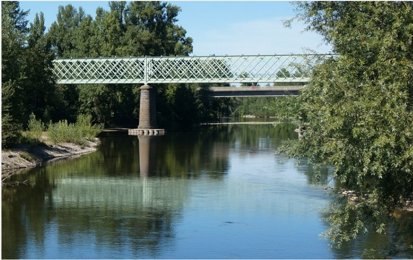
Pont vert de Dallet (Denis Cibien)