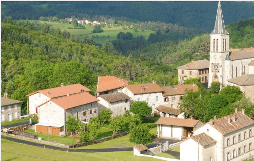
Vue sur le bourg de Baffie