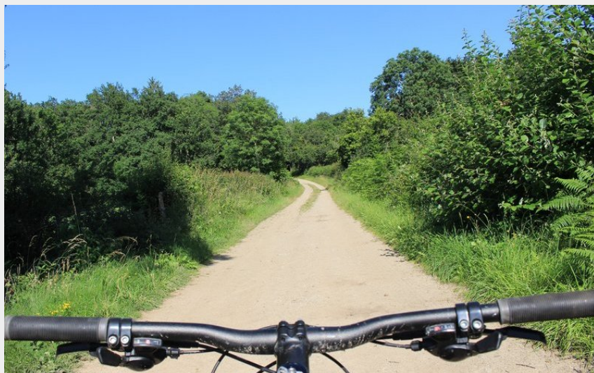
chemin (Maison du Tourisme)