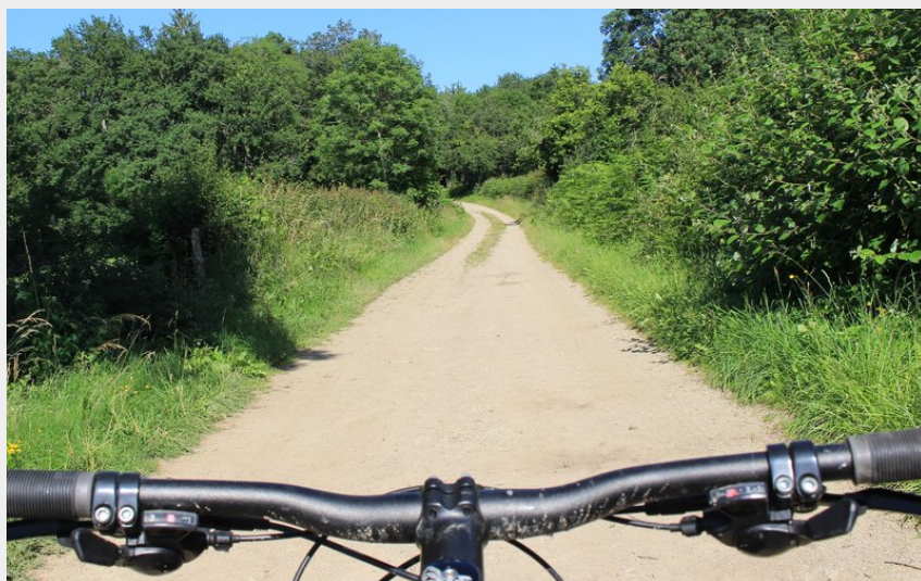
chemin (MDT LF)