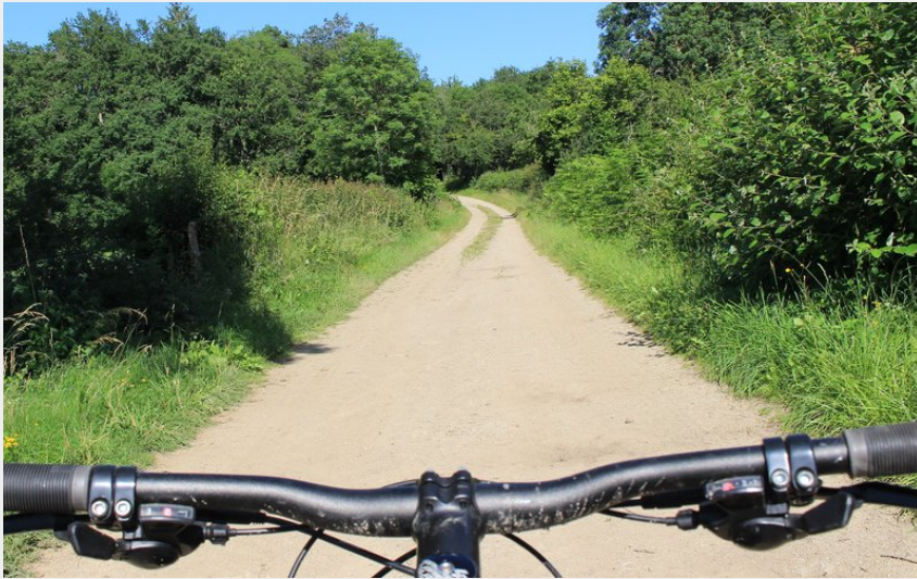
chemin (MDT LF)