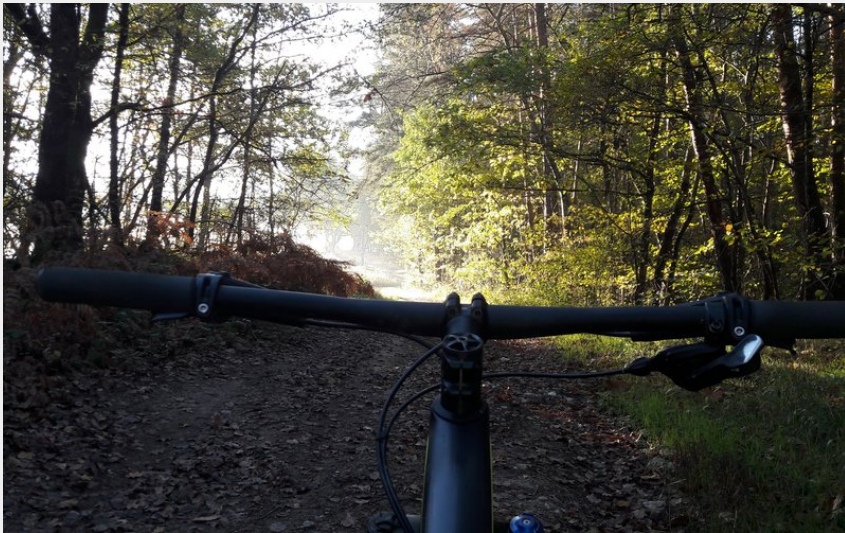
chemin (Centre VTT Bois Noirs)