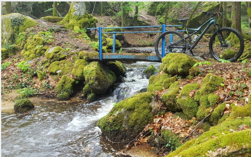
La Credogne (Centre VTT Bois Noirs)