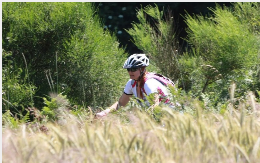
Randonneuse VTT (Centre VTT Bois Noirs)