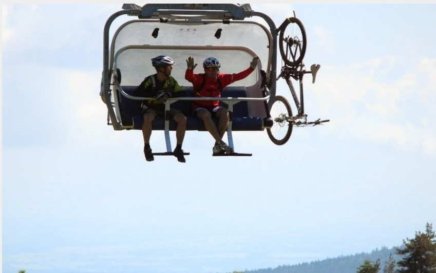
Remontée à Chalmazel (Centre VTT Bois Noirs)