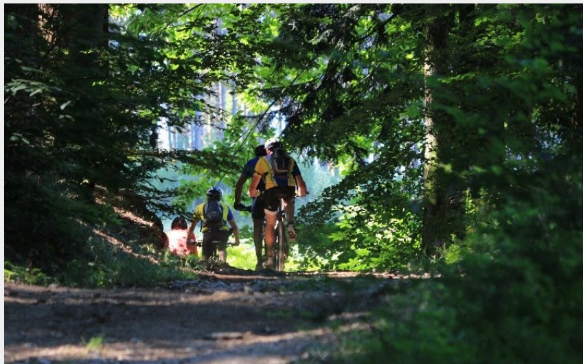
Chemin près de Celles sur Durolle (Centre VTT Bois Noirs)