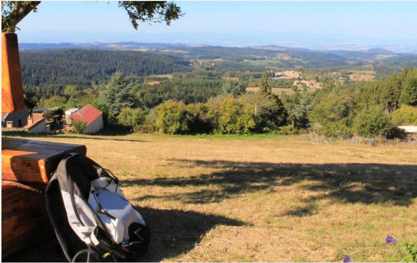
point de vue en Livradois-Forez (Maison du Tourisme)