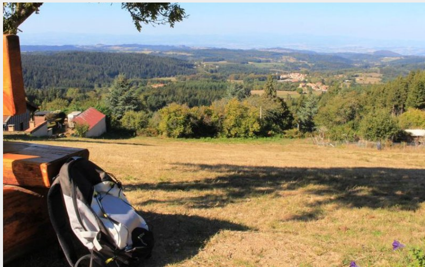
point de vue en Livradois-Forez (Maison du Tourisme)