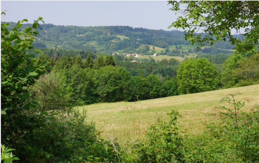
Vue depuis les Faidides (Maison du Tourisme Sébastien Giraud)