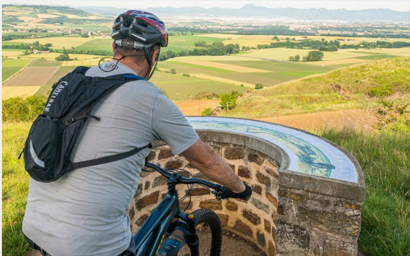
Point de vue depuis la tour de Courcourt