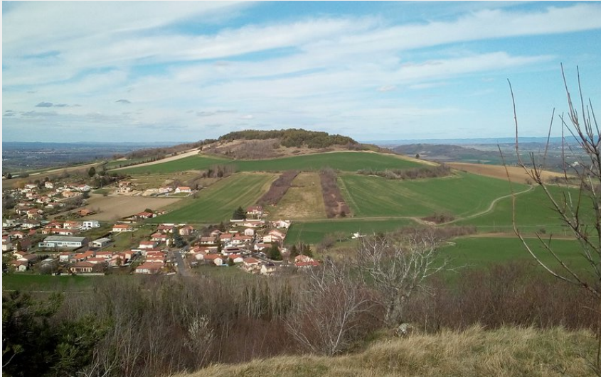
Le Puy de Pileyre (Billom Communauté)