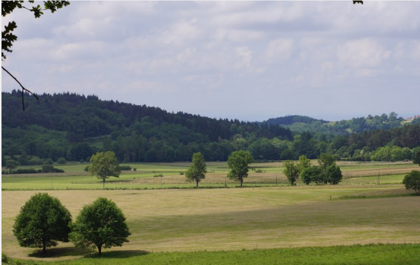
Vue a Saint-Jean-des-Ollières (Maison du Tourisme Sébastien Giraud)