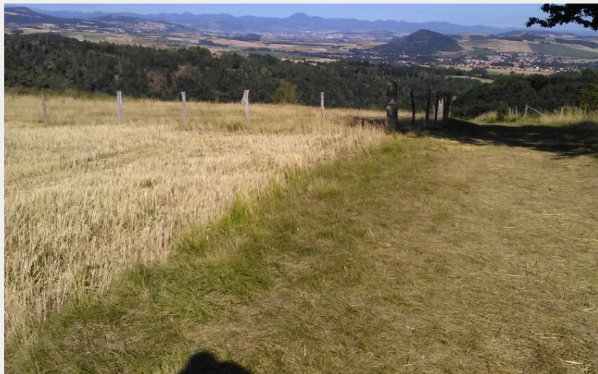
Vue depuis la table d'orientation (Maison du Tourisme)