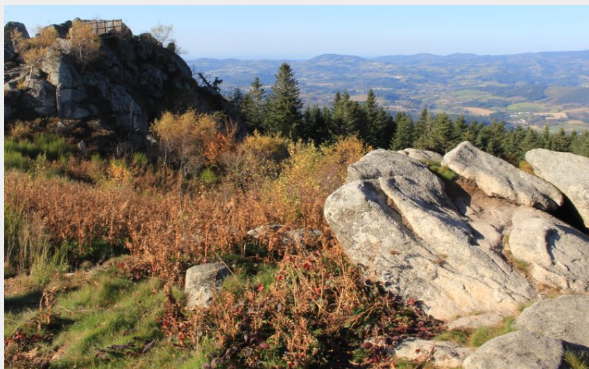
Vue depuis Pierre Pamole (Maison du Tourisme Sébastien Giraud)