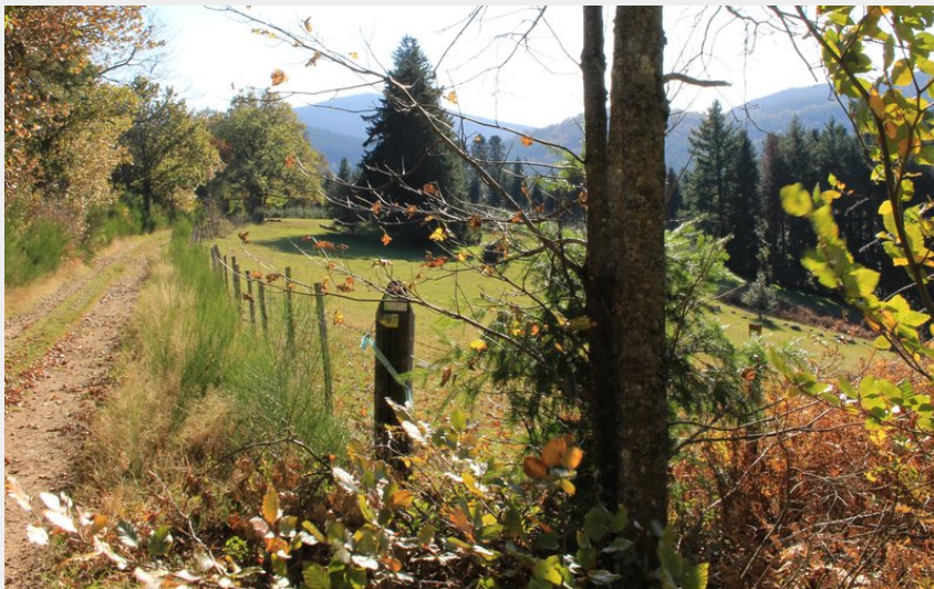
Vue sur le chemin