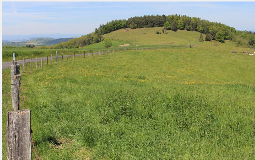
Le grün de Côte (Maison du Tourisme)