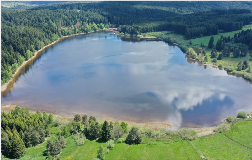
Vue sur le Lac de Malaguet (Jacques JACOB)