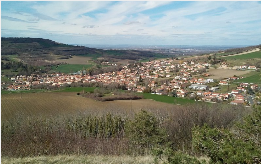
Vue sur Chauriat (Billom Communauté)