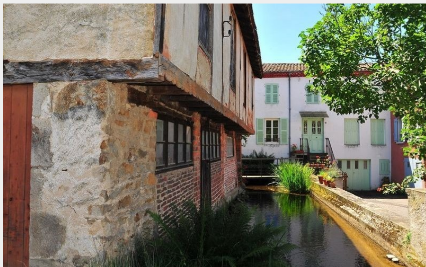
(Agglo du pays d'Issoire)