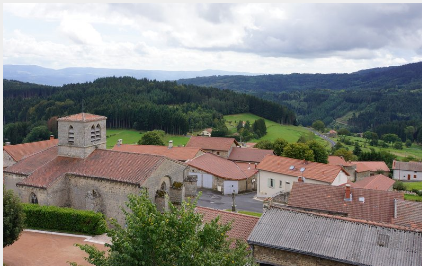
Le Monestier (Maison du Tourisme)