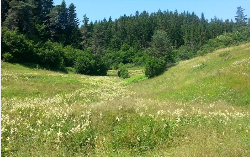
Ruisseau de Ronaye (Maison du Tourisme)