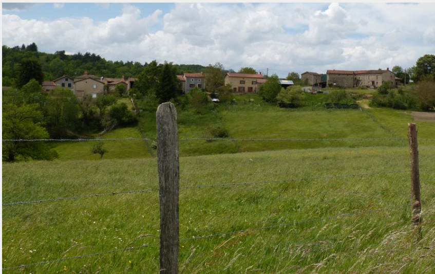
Village de Saint-Dier (MDT)