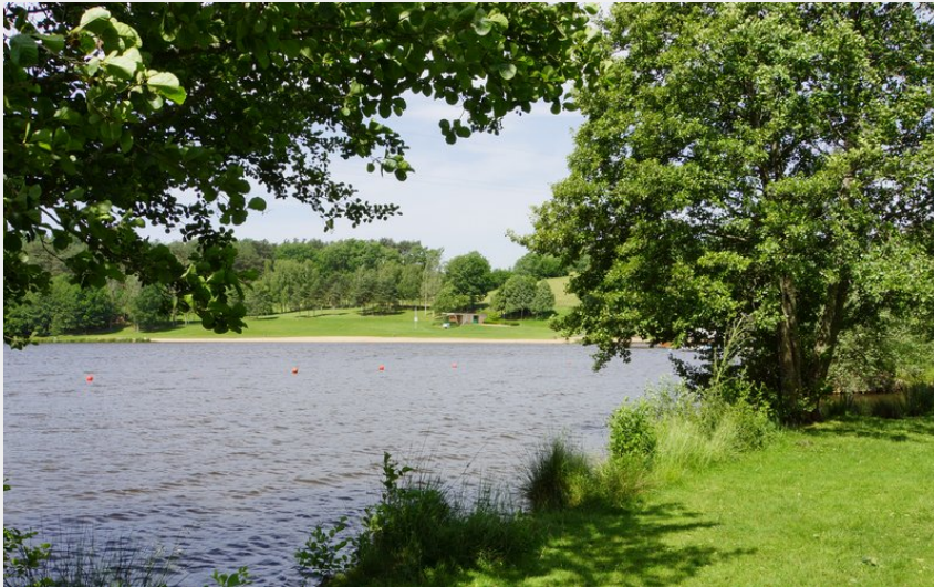
Lac et sous-bois (MDT)