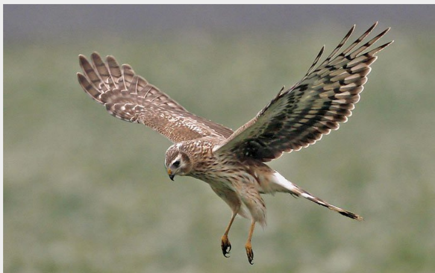
Busard Saint Martin femelle (PNRLF)