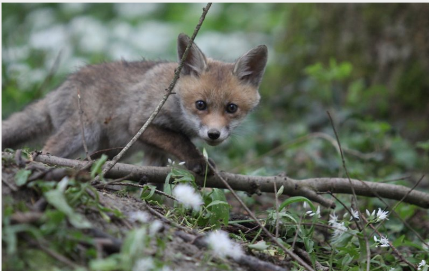
Sur la piste des mammifères sauvages_Sallèdes