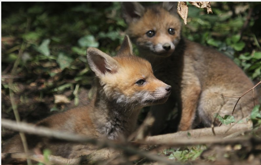
Crédit photo : Mystères et croyances autour des animaux de la forêt_Sallèdes (C. Tournadre)