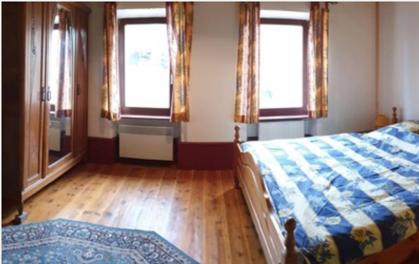
Crédit photo : Une des chambres du gîte de groupe de Trézioux (gîte du Trézioux - Virginie Lacombe)