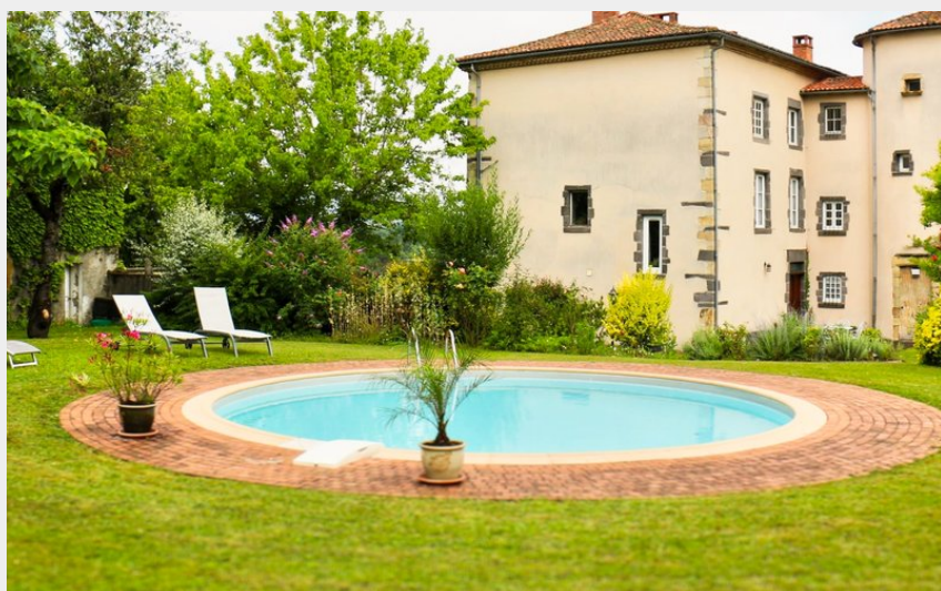
Vue extérieure sur le Clos et la piscine