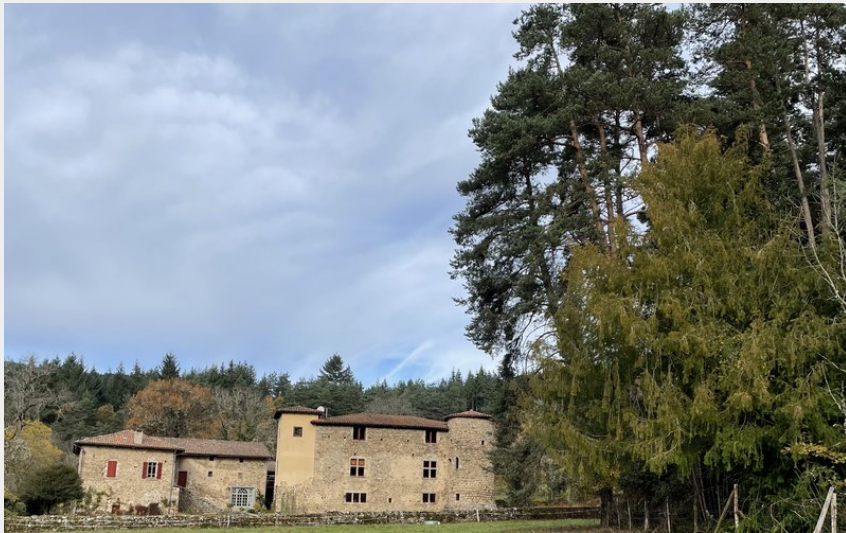
Le château dans son écrin de forêts et de prés