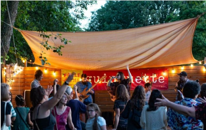
Crédit photo : Guinguette Folle Allier_Sauxillanges (Sophie Fournet)