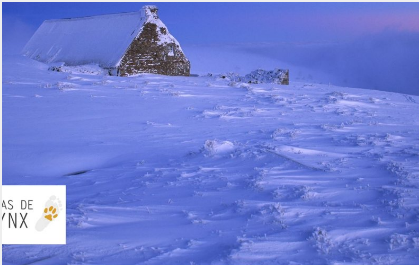
Crédit photo : Raquettes et casse croûte au col des supeyres (A Pas de Lynx)