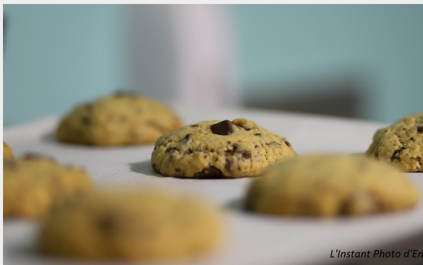
L'Instant Photo d'Emilie

cookies double chocolat