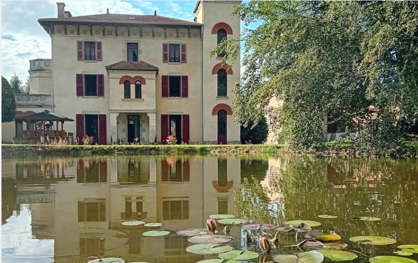
Extérieur du Domaine de Marchal