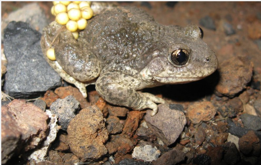
Crédit photo : Petits monstres au clair de lune_Sallèdes (Lionel PONT)