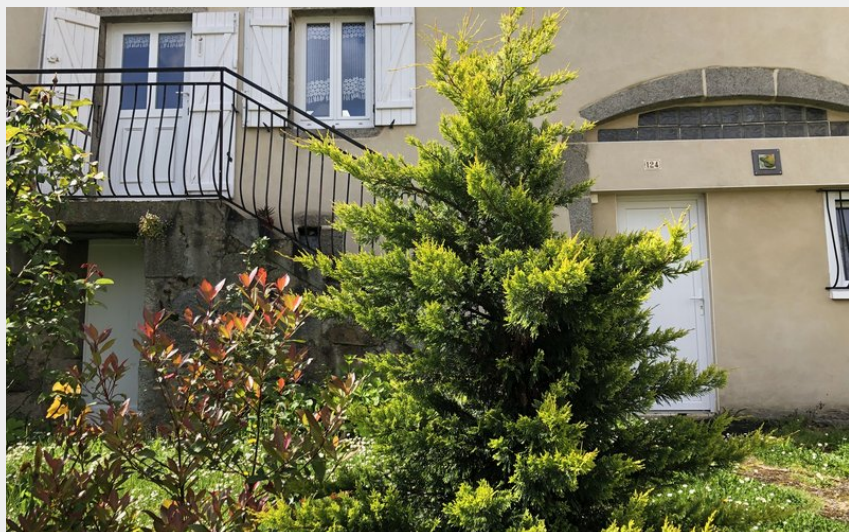
Crédit photo : Entrée de la maison sur cour privée (Marie Calderon)