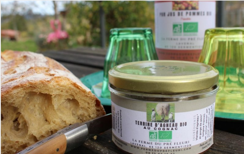
Crédit photo : Les produits BIO de la Ferme (La Ferme du Pré Fleuri)