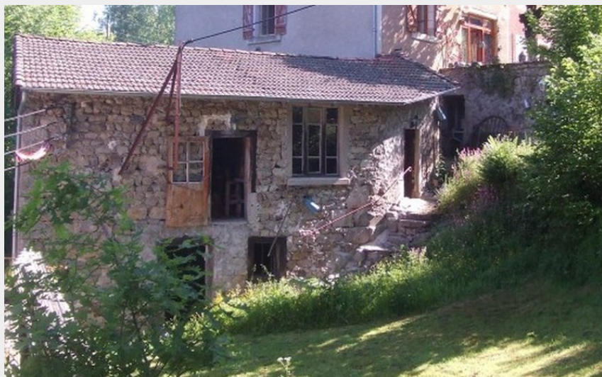
le moulin à meule au pied des chambres